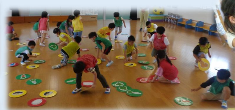
1回戦!...赤キッズが1位☆