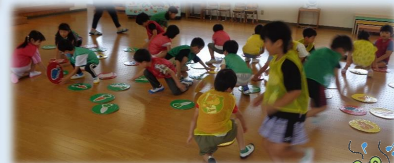
2回戦!...黄キッズが1位☆