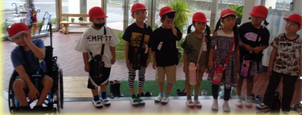
1年生さん!いらっしやい♡待ってたよ～!